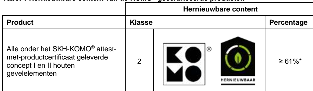
Tabel 1 Hernieuwbare content van de KOMO ® gecertificeerde producten

* gebaseerd op kozijnen en ramen vervaardigd met uitsluitend houten dorpels en stijlen, exclusief vakvulling.