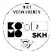
geschikt voor weerstandsklasse 2