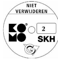
geschikt voor weerstandsklasse 2